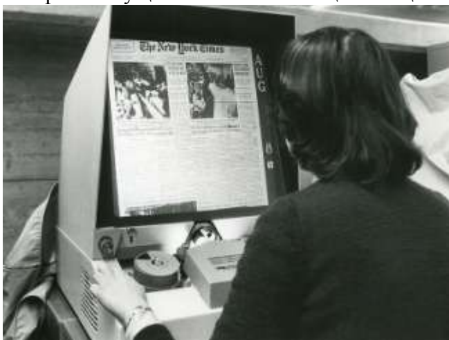
Читальный аппарат. Начало 1980-х гг.

Создание таких копий и с их помощью решение второй задачи с конца 1930-х годов (в Советском Союзе и Российской Федерации – с конца 1950-х гг.) апробированный ответ. Широкое использование архивных документов обеспечивается трудоемким, но надежным методом копирования – микрофильмированием, и для пользователей в читальных залах представляется в виде микрофильмов / микрофиш второго и третьего поколения, работа с которыми осуществляется с помощью специализированных читальных аппаратов.