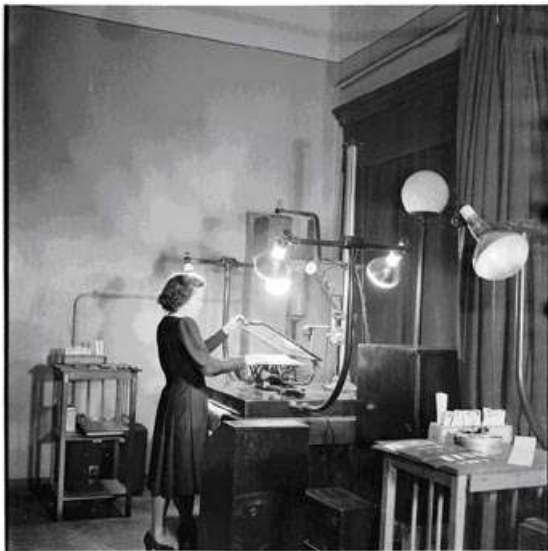
Лаборатория микрофильмирования Ленинской библиотеки (ныне РГБ). 1957 г.

В библиотечной сфере Советского Союза и Российской Федерации, к сожалению, микрофильмирование не заняло подобающего ему места, что было отмечено в Национальной программе сохранения библиотечных фондов РФ, принятой в 2000 г. Для исправления ситуации в ней, в частности, предполагалось развитие отдельной подпрограммы Создание Российского страхового фонда документов библиотек, куратором которой должна стать Российская государственная библиотека.