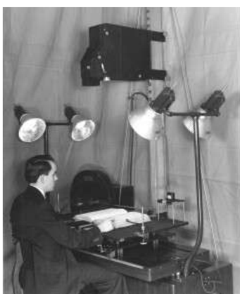
Первая микрофильмирующая камера в NARA. 15 января 1937 г.

Так, Библиотека Конгресса и Национальное управление архивов и документации (National Archives and Records Administration (NARA)) (США) уже в середине 1930-х гг. имели собственные лаборатории микрофильмирования и достаточно большие собрания микрофильмов.