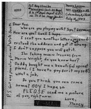
V-mail письмо. Написано в 1943 г.