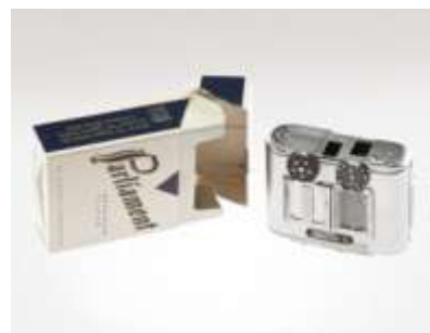
Варианты шпионских микрофотокамер середины XX в.

Таким образом, создание микрофильмов, несмотря на достаточно сложную и недешевую технологию в середине XX в. стало рассматриваться, как своего рода, панацея для решения вопросов компактного и долгосрочного хранения информации.