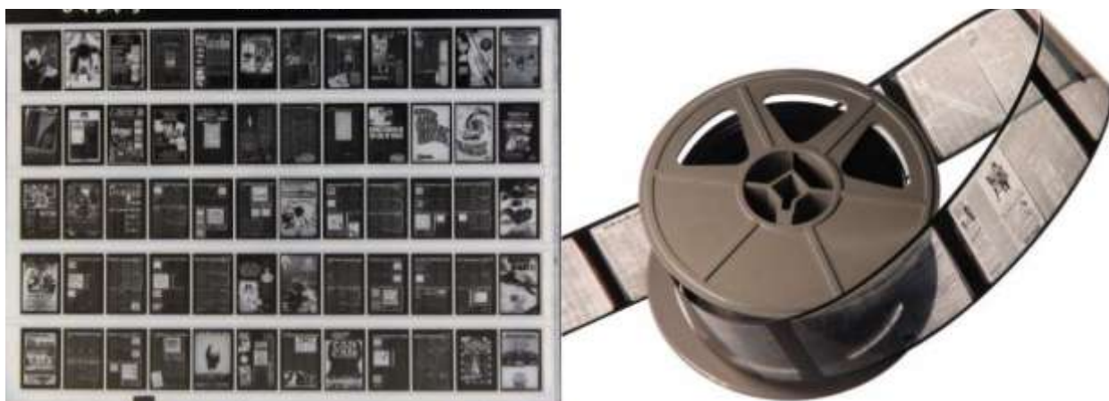
Микрофиша и рулон микрофильма

частности, компании «Кодак», которая разработала и представила на рынке устойчивую к «уксусному синдрому» микроплёнку на основе полиэстра. Эта новация была первоначально закреплена стандартами национальной системы США ANSI, а затем и стандартами системы ISO, что стало еще одним, дополнительным и неоспоримым аргументом в пользу широкого применения технологии микрофильмирования.