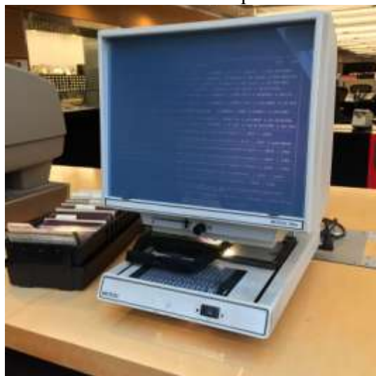
Аппарат для чтения микрофиш. Начало 2000-х гг.

Микрофильмы знакомы всем пользователям крупнейших архивов и библиотек, и в настоящее время считаются технологией устаревшей или устаревающей. Но большинство читателей, а также сотрудников архивов, библиотек и иных учреждений, где используются микрофильмы, не догадываются о возможностях этой технологии и перспективах ее развития.