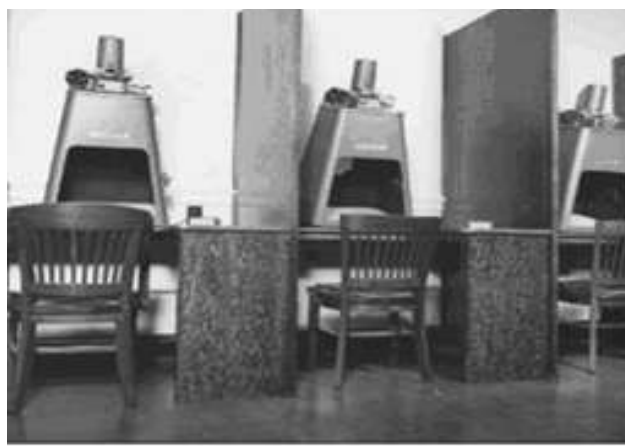
Создание микрофильма. NARA. 1949 г.