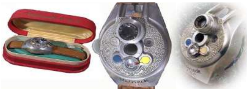
Steineck ABC Wrist Watch Camera, 1940-е гг.