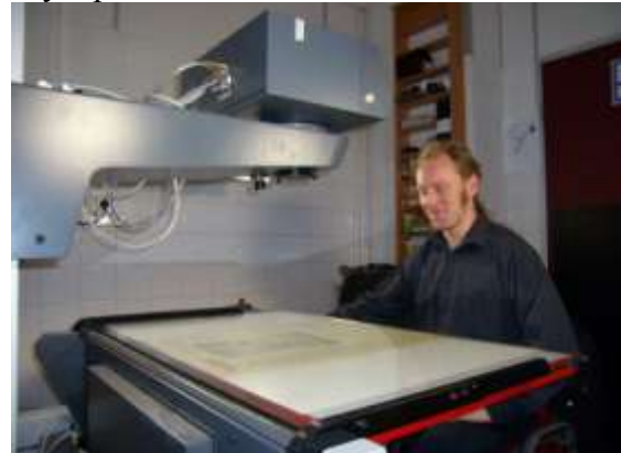
Лаборатория микрофильмирования Всероссийской государственной библиотеки иностранной литературы.