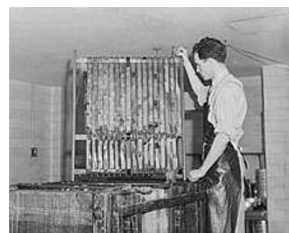
Создание микрофильмов. Библиотека Конгресса. Июль 1942 г.

Преимущества данной технологии были по-новому оценены в годы Второй мировой войны, когда правительственные органы США и других стран нашли многочисленные варианты использования микрофильмов (Victory-mail (V-почта) 2 , шпионаж, хранение больших объемов документов, тиражирование технической документации для оборонных предприятий и т.п.).