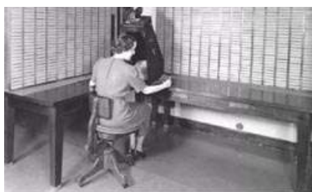
Каталог микрофильмов. Бюро Ветеранов. NARA. 1939 г. 1