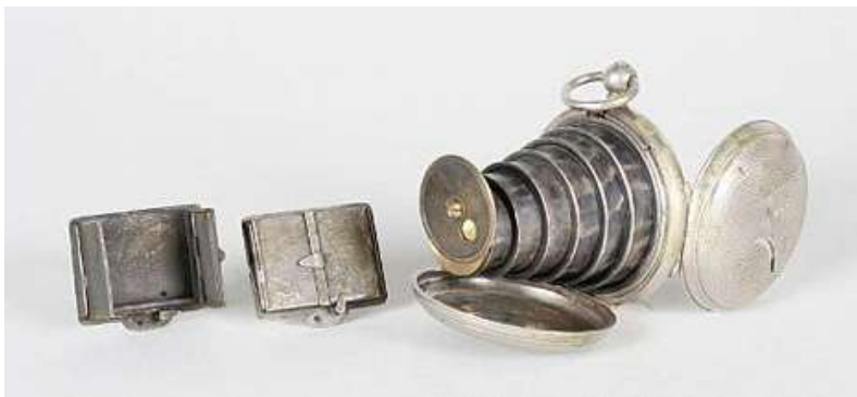
Lancaster Pocket Watch Camera, 1886 г.

Справедливости ради нужно подчеркнуть, что шпионское оборудование на основе микрофотокамер было изобретено еще в XIX в.