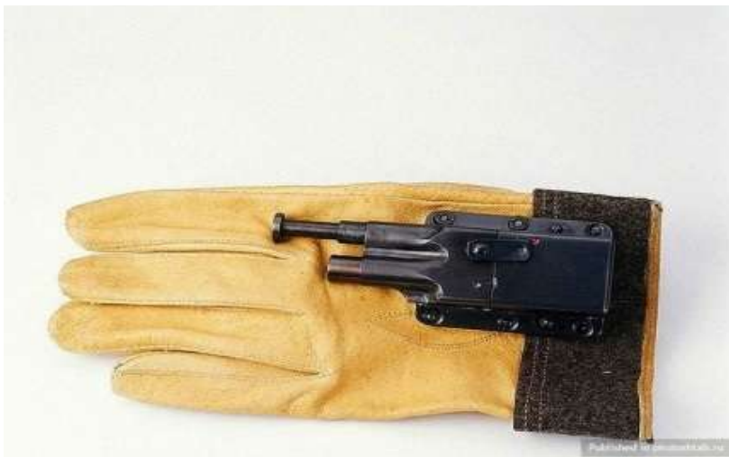
Начало XX в. Германия.